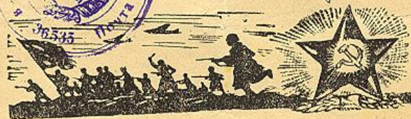
Благодарность «За отличные боевые действия при переходе границы Германии» Благодарность «За овладение столицей Германии городом Берлин»