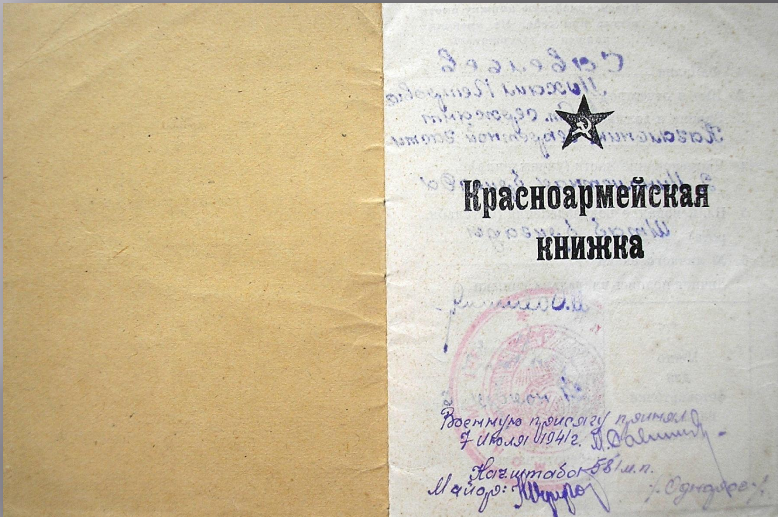
Надпись на Красноармейской книжке: Военную присягу принял 7 июля 1941 года.