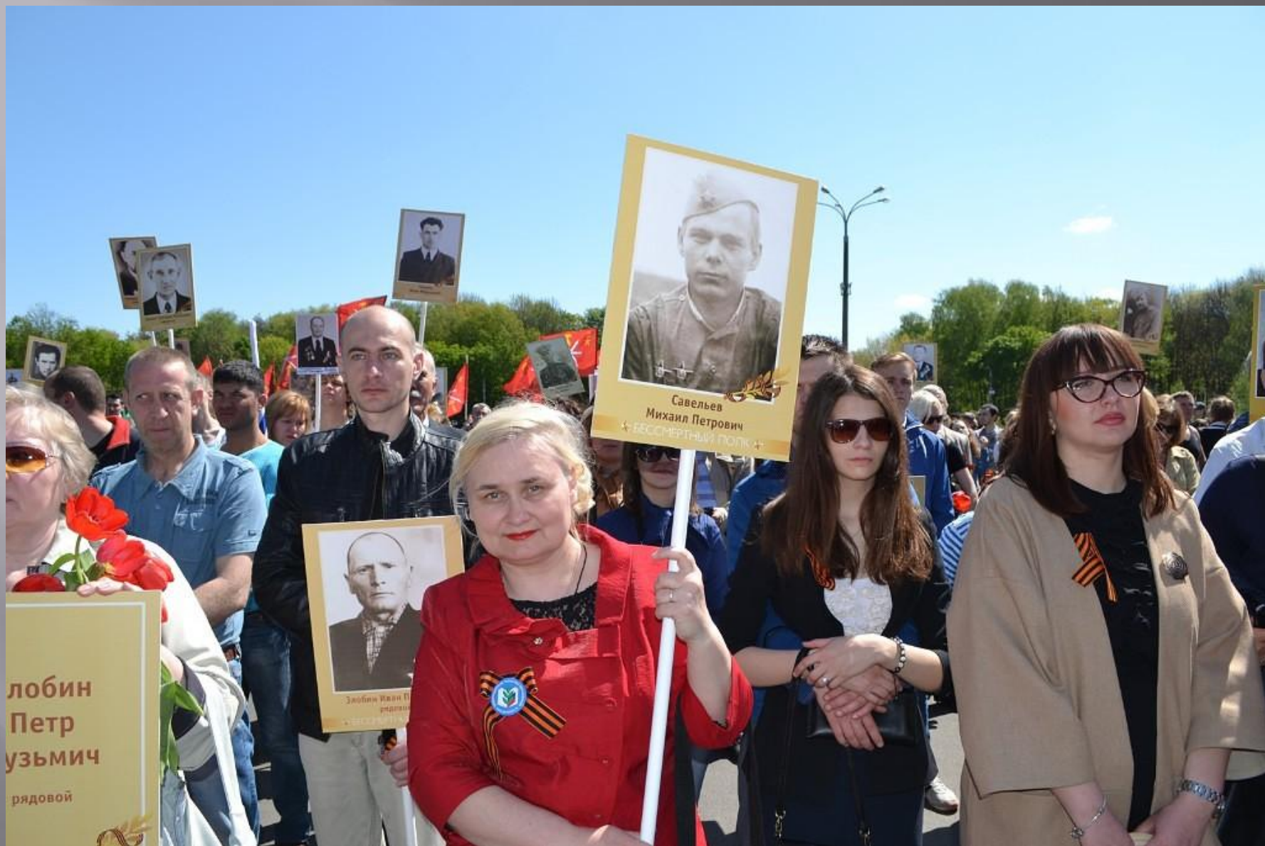
«Бессмертный полк» Тула 9 мая 2014 г.