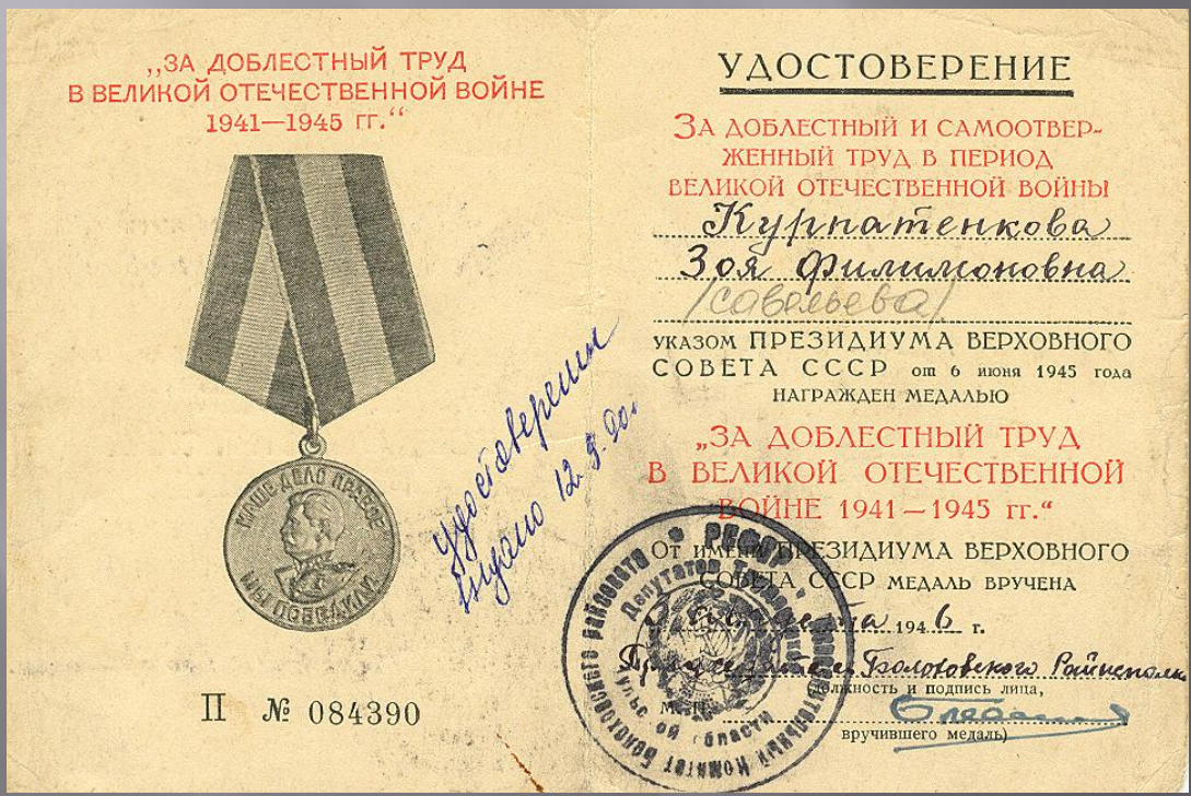
Медаль «За доблестный труд в Великой Отечественной войне 1941-1945 гг.»