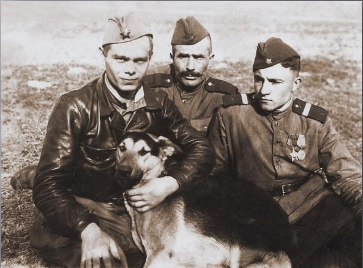
Мой дедушка с полковыми товарищами и собакой по кличке Пират.