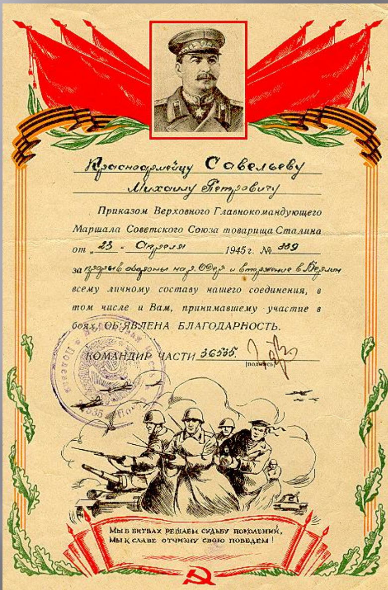
Благодарность «За прорыв обороны на р.Одер и вторжение в Берлин» Газета «ИЗВЕСТИЯ» от 9 мая 1945 года.